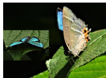
【メスアカミドリシジミ】 7/7