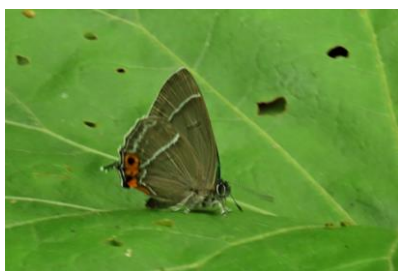
【アイノミドリシジミ】 6/30

7月上旬、「ゼフィルス」と呼ばれるシジミチョウが見られるようになりました。カラフルで美しく輝く翅は見ていてハッとさせられます。センター周辺では木の葉先でオスが翅を広げ、縄張りを示す行動が見られます