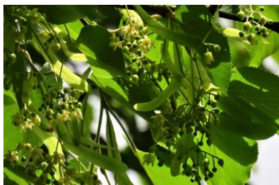
【オオバポダイシュ】 7/7

木々の葉も一層濃くなり、「春の森」から濃い緑に覆われた「夏の森」へと姿を変えています。センター周辺では木々に白い花が目立ちます。そして多くの虫たちが蜜を吸いに白い花に集まってきています。