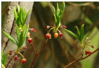
コヨウラクツツジ 4/20

新緑が眩しく気持ちの良い季節です。センター周辺から見える景色は、日を追うごとに木々の 緑が濃さを増しています。林床に咲く春の花は初夏の花へと移り変わり、次から次へと山に彩り を添えています。野鳥や昆虫などの生き物たちも活発になってきました。 5月17日には、エゾハルゼミの初鳴きを確認しました。