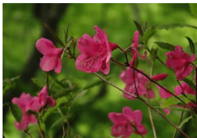
ムラサキヤシオツツジ 5/1