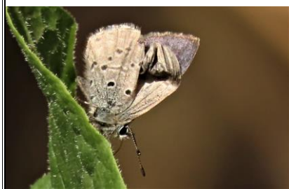
スギタニルリシジミ 5/9