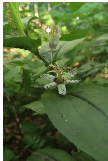
ヤマジノホトギス 8/17