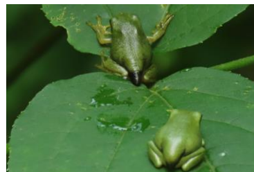
モリアオガエル (幼体) 8/3