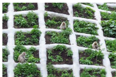
ニホンザル 7/8 (駐車場斜面)