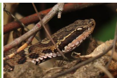
マムシ (毒) 7/6