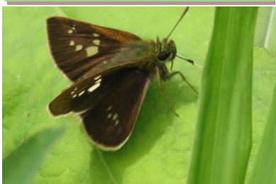
オオチャバネセセリ 7/8