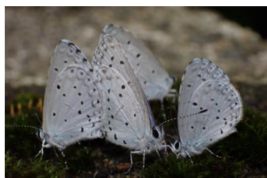
ルリシジミの吸水 7/6