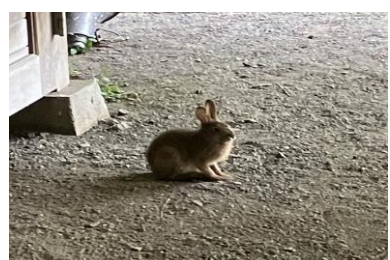
ニホンノウサギ 7/17 (センターガラリ)