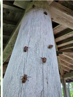
柱にたくさんのセミの抜け殻