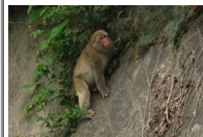
ニホンザル 7/31 (市道)