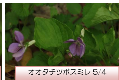
オオタチツボスミレ 5/4