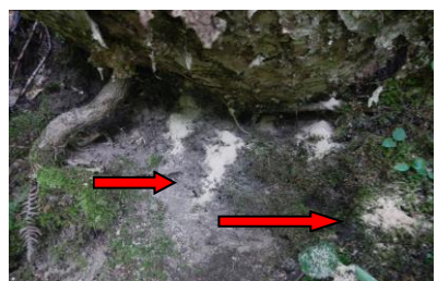
根元に溜まったフラス(木くず)