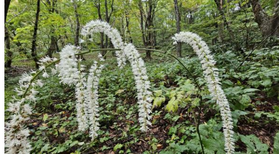
サラシナショウマ 10/4