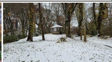
寺屋敷北広場 11/7 積雪約3cm