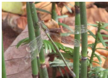
オオアオイトトンボ 11/4