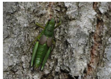
ミカドフキバッタ 11/4