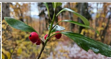
マンガンの道 5合目付近 11/7