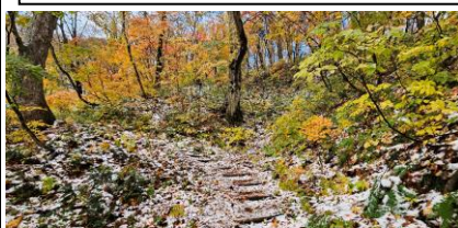
サワグルミの道 6合目付近 11/7

11月7日には、梵珠山で「初雪」を確認しました。紅葉が終わりきらないうちに雪がうっすら積もり、色鮮やかな紅葉を引き立て特別な景色を見せてくれました。