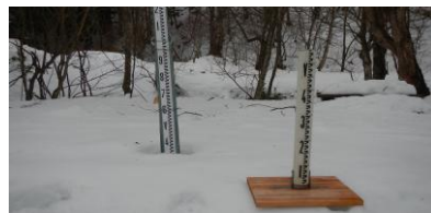
積雪計(左)と降雪計(右)