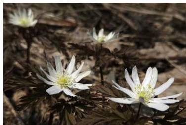
キクザキイチリンソウ 4/13