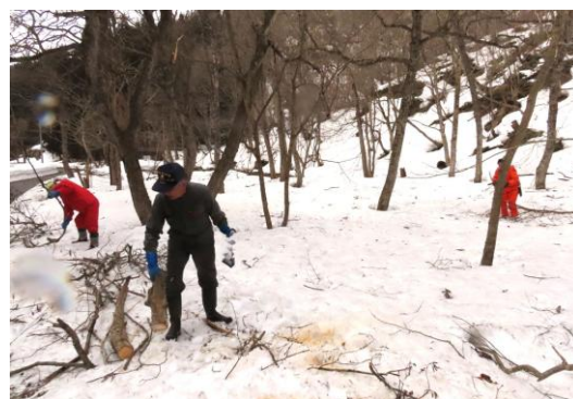
ミズバショウ湿地の倒木作業

今年は、昨年以上に倒木が多くミズバショウの湿地でもハンノキやトチノキの大木が数本倒れました。参加者は、雪の上に横たわった木の幹の切断や市道に散らばった枝の片付けを行い、少しでもキレイになればと自分たちのできる範囲で作業を進めていました。今回1回では終われず、引き続き4月もまた行いたいと思います。サポーターズ隊の皆さん、ありがとうございました。