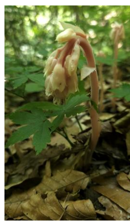
シャクジョウソウ 7/12