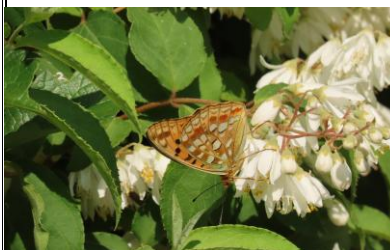
ウラギンヒョウモン 6/28