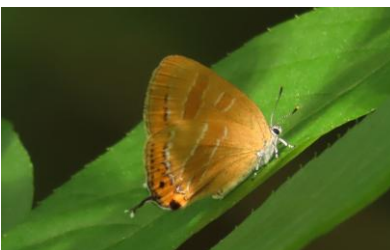
カシワアカシジミ 7/6