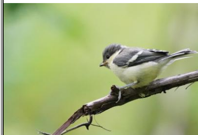
シジュウカラ（幼鳥） 6/21